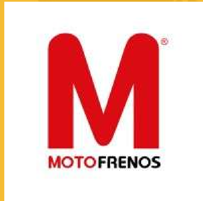
MotoFrenos - Colombia

MotoFrenos SAS es una empresa metalmecánica fundada en 1978. Se especializa en el diseño, fabricación y montaje de equipos y repuestos para el sector industrial en general. El departamento de producción cuenta con una línea flexible de manufactura y brindamos servicios a múltiples sectores de la industria colombiana. Además, los productos y servicios de MotoFrenos se exportan a 21 países de Europa, América del Sur, Central y del Norte.