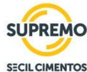
Supremo Secil Brasil