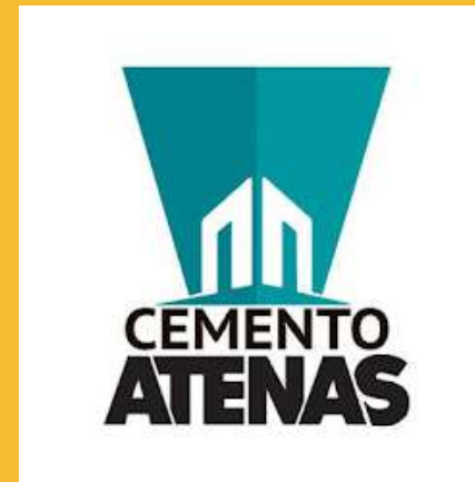
Cemento Atenas Ecuador