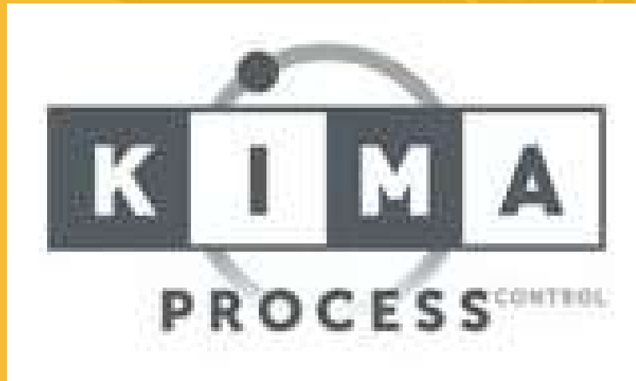
KIMA Process - Germany

KIMA Process Control brinda experiencia en medición y control avanzados en procesos de molienda de cemento y piro procesos, desarrollando nuevas tecnologías de sensores y sistemas de control avanzados durante casi 25 años. Su enfoque es el desarrollo, producción y comercialización de tecnologías de control y medición industrial.