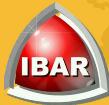
IBAR Refractories Brasil