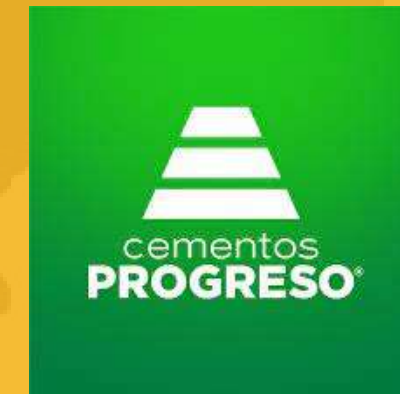
Cementos Progreso Guatemala