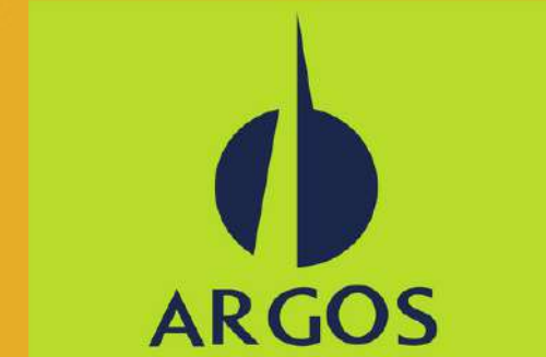
Cemento Argos Colômbia