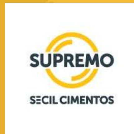
Supremo Secil Brasil