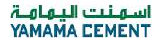
Yamama Cement - Arábia Saudita